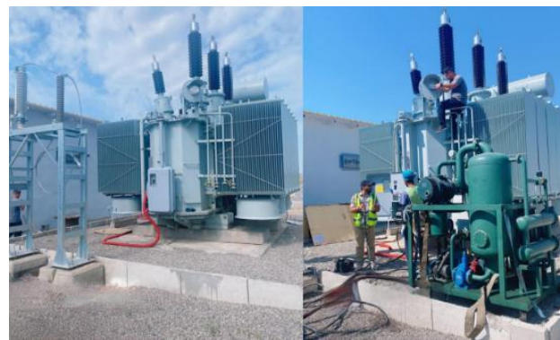
Transformador de potencia 40 MVA, Armenia