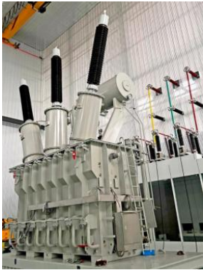
Proceso de pruebas e inspección Transformador de potencia 75 MVA, Ecuador