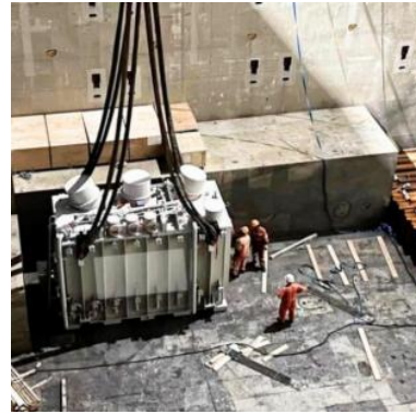
Proceso de carga Transformador de potencia 75 MVA, Ecuador