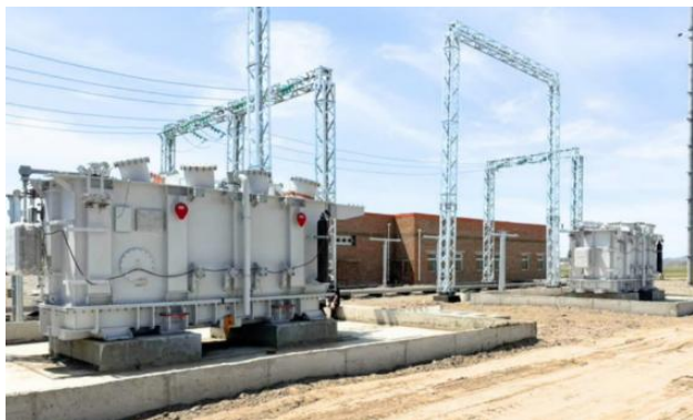
Transformador de potencia 16/20 MVA, Uzbekistan